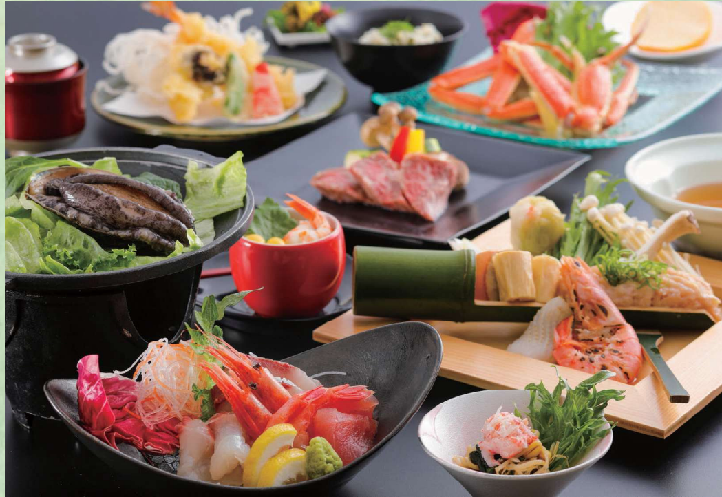
あわび×和牛×カニの三大会席[イメージ]