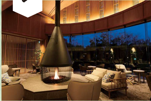
ロビー 2022年秋リニューアル